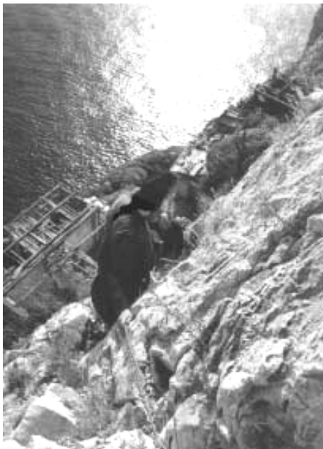
Вниз по Каруле