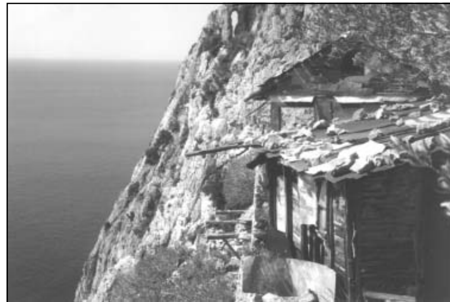
Келья современного русского карульца