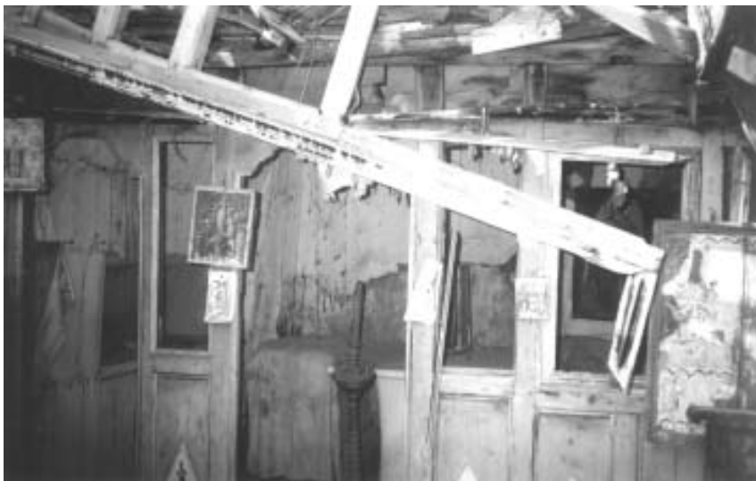
Келья Рождества Христова