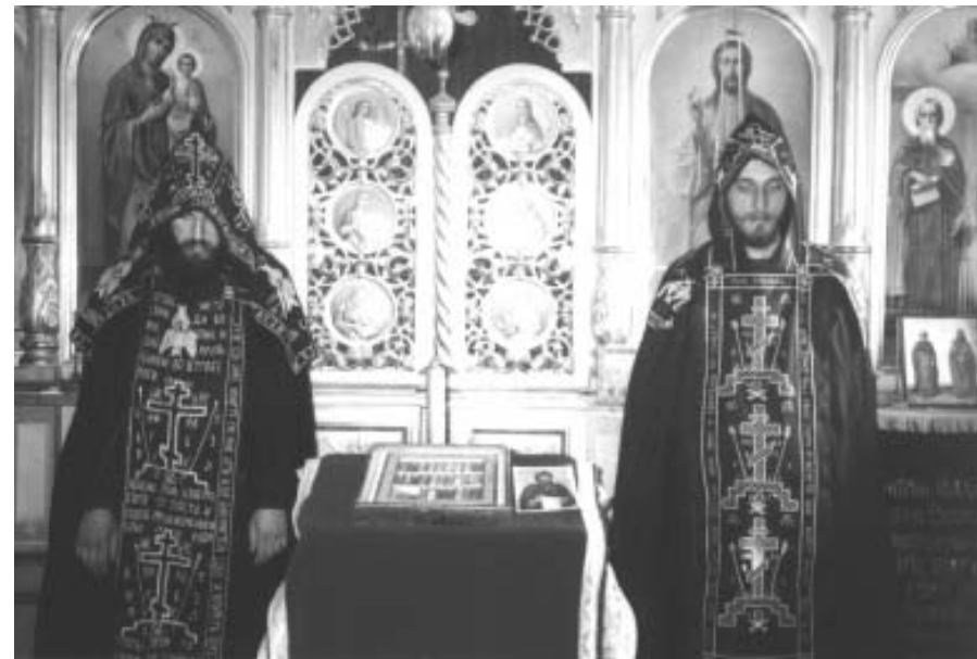
В храме святителя Иннокентия Иркутского