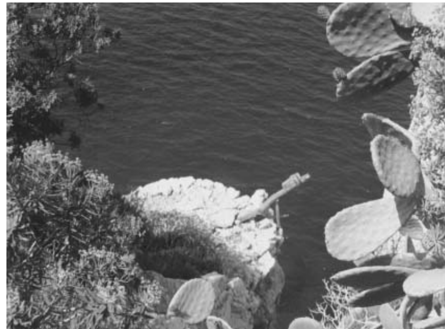
В центре фотографии видна каруля.

Ещё дальше. Вот виден свет. Это выход. Здесь небольшая площадка над пропастью, на которой видны следы пребывания человека. Некоторые